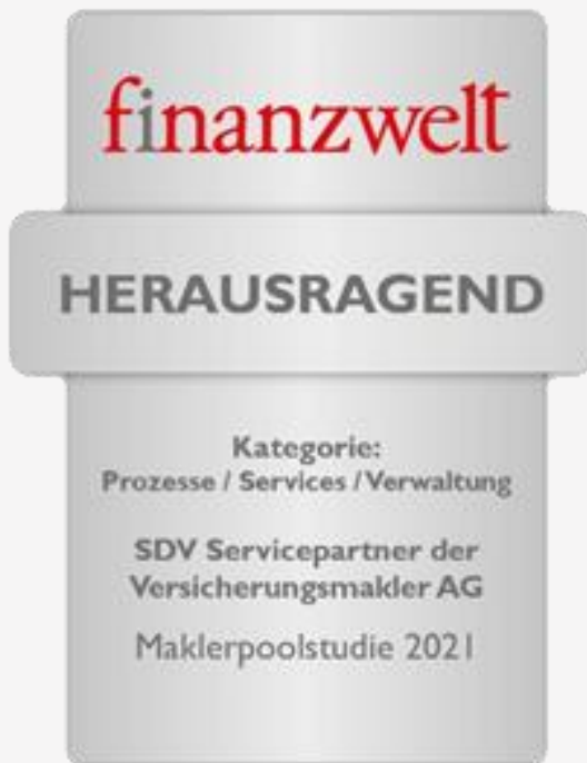
Prozesse/Services/Verwaltung (98 von 100 möglichen Punkten)